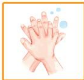
... și degetele