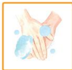
Acoperă mâinile cu spumă